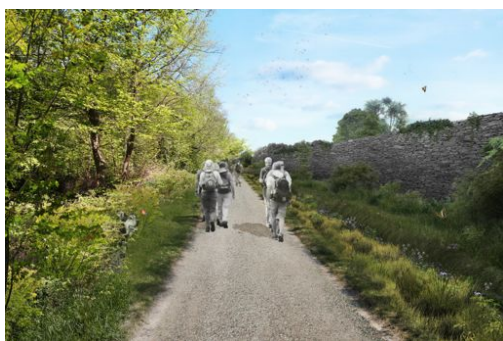
Bois de Grandville_Yerres_©Smer la Tégéval - Tijani Loussaief